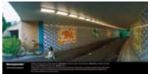
'Berenparade' 2001 Gemeente Utrecht, HOV Projectbureau Utrecht