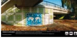
'Sisters in Paradise' 2003 Gemeente Utrecht Utrecht