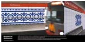
'Groeten uit Delfshaven' 2001 RET Rotterdam Rotterdam