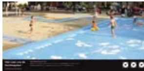
'Het lied van de Nachtgale' 2005 Gemeente Utrecht Utrecht