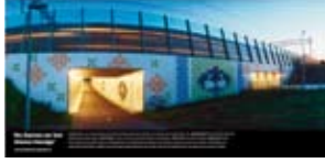
'De Dames en het kleine Hondje' 2004 Prorail Betuweroute, Nederlandse Spoorwegen Barendrecht