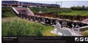
'Hortus Conducus' 2006 GZH en Prorail Bleiswijk