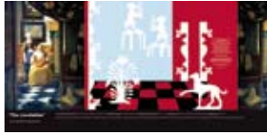
'The Lovelletter' 2006 Ikea Concept Centre Delft