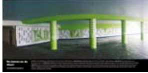
'De Dames en de Muze' 2003 Stadsdeel Bos en Lommer en Rijkswaterstaat Amsterdam