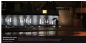
'De Moor, de Dame en haar Hondje' 2006 NS Vastgoed Amsterdam