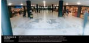
'Les Dames et la Licorne' 2004 AM Vastgoed BV Amsterdam