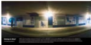
'Sitting in Blue' 2001 Gemeente Utrecht Utrecht