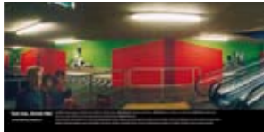
'Eat me, Drink me' 2002 Rodamco Nederland Hilversum