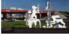
'De Liefdesbrief' 2007 Gemeente Delft Delft