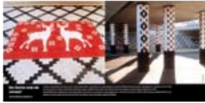
'De Dame met de Zwaan' 2003 Prorail Gorinchem