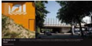
'De Dame en de Muze' 2006 Stadsdeel Slotervaart Amsterdam