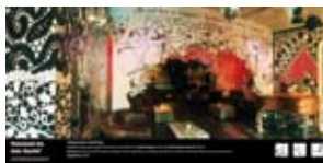
'Duizend en één Nacht' 2005 Kunstenaarsvereniging De Kring Amsterdam