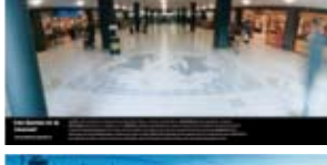
'Les Dames et la Licorne' 2004 AM Vastgoed BV Amsterdam