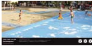
'Het lied van de Nachtgale' 2005 Gemeente Utrecht Utrecht