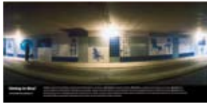
'Sitting in Blue' 2001 Gemeente Utrecht Utrecht