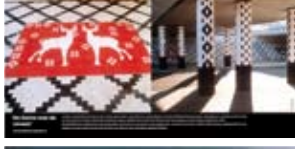
'De Dame met de Zwaan' 2003 Prorail Gorinchem