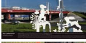
'De Liefdesbrief' 2007 Gemeente Delft Delft