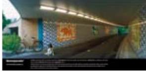
'Berenparade' 2001 Gemeente Utrecht, HOV Projectbureau Utrecht