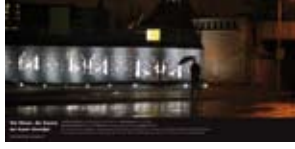
'De Moor, de Dame en haar Hondje' 2006 NS Vastgoed Amsterdam