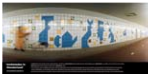
'Archimedes in Wonderland' 2001 Gemeente Utrecht, HOV projectbureau Utrecht