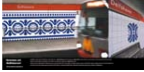
'Groeten uit Delfshaven' 2001 RET Rotterdam Rotterdam