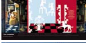
'The Loveletter' 2006 Ikea Concept Centre Delft