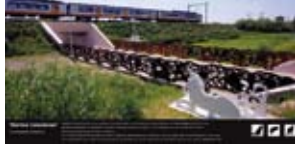
'Hortus Conditus' 2006 GZH en Prorail Bleiswijk