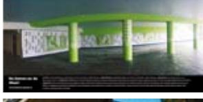
'De Dames en de Muze' 2003 Stadsdeel Bos en Lommer en Rijkswaterstaat Amsterdam