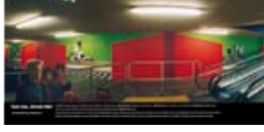
'Eat me, Drink me' 2002 Rodamco Nederland Hilversum