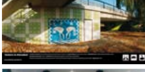
'Sisters in Paradise' 2003 Gemeente Utrecht Utrecht