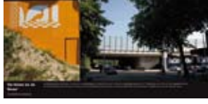
'De Dame en de Muze' 2006 Stadsdeel Slotervaart Amsterdam