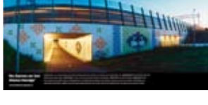
'De Dames en het kleine Hondje' 2004 Prorail Betuweroute, Nederlandse Spoorwegen Barendrecht