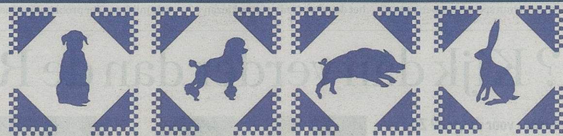
De tegels. 'De kinderen wilden het liefst dieren'.