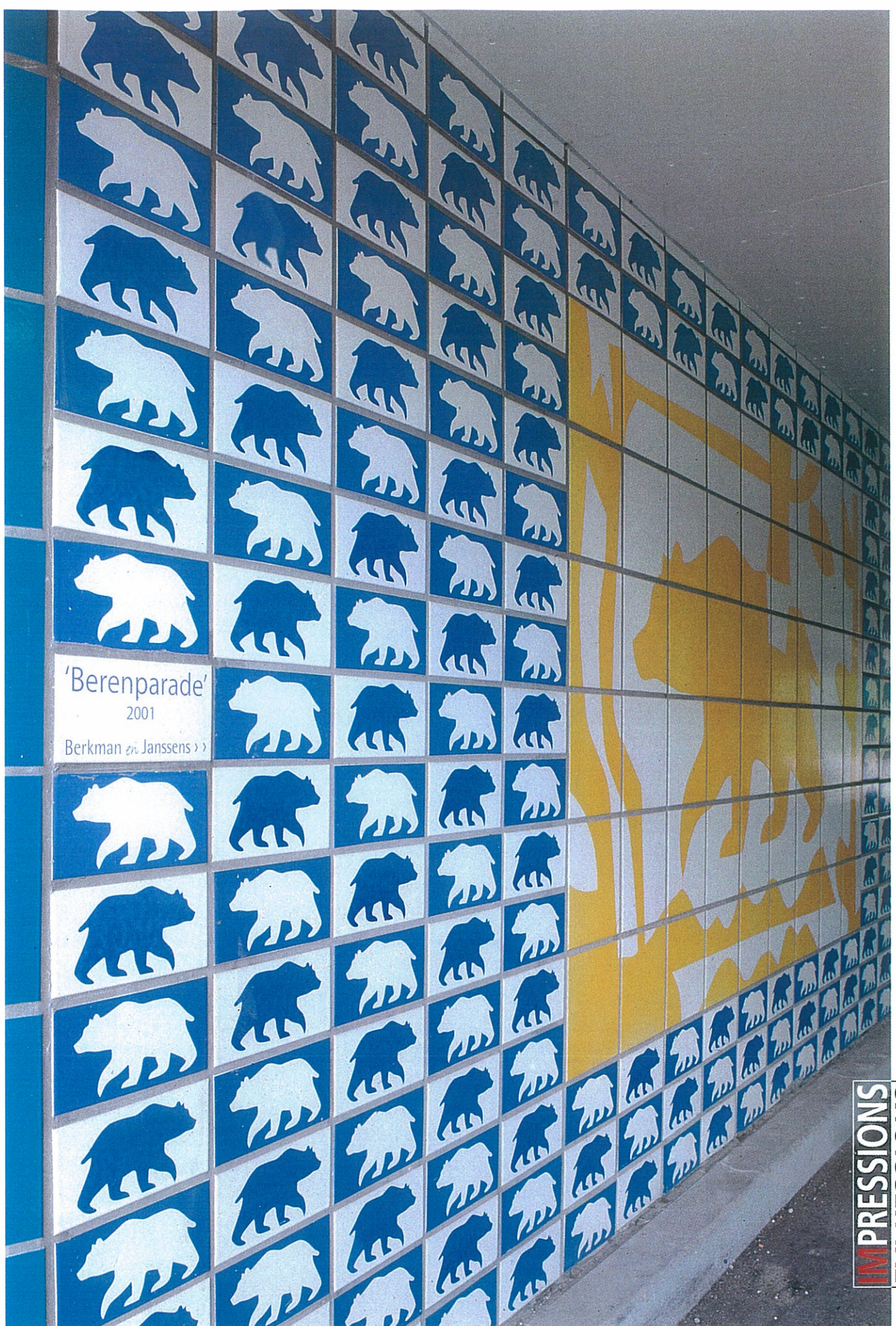
Project: Berenparade, Utrecht. Opdrachtgever: Gemeente Utrecht/HOV. Kunstenaars: Berkman en Janssens, Utrecht. Aannemer: J.H. Spoelman, Amsterdam. Tegelzetter: Koop Tjuchem, Nieuw Venneep. Gebruikte tegels: Gail Inax. Levering tegels: De Boo Regio West.