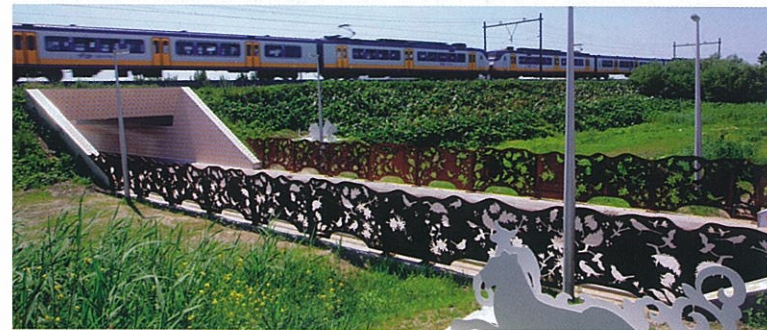
Hortus Conclusus bevindt zich in twee fietstunnels en de openbare ruimte daartussenin.

al kunstenaars en architecten keramiek ingewikkeld toe te maken. Je hebt te maken met kleurverandering tijdens bakken. Of het lukt niet om bepaalde elementen glanzend te maken. Beperkt ook het kleurenpalet. Elk tegelfabrikant levert de kleuren, maar uitgesproken zijn in de regel moeilijk te dupliceren. Daar komt bij dat je voor openbare ruimten duurzame, poreuze tegels nodig hebt." ssens vervolgt: "Iedereen vindt van mooie keramiek. Het is prachtig, schoon, duurzaam en duurzaam. Soms spelen we met glans van het glazuur, met glans