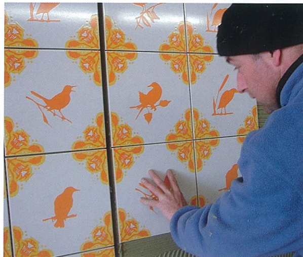
De Hortus Conclusus bevat 1200 vierkante meter tegel met oranjegekleurde motieven van vogelsoorten uit het Rottmerengebied.

of juist met contrasten tussen glans en mat. Bijvoorbeeld dat we de decoratie glanzend maken en de rest van de tegel mat. Keramiek heeft voor ons niet zoveel beperkingen. We passen overigens niet uitsluitend keramiek toe; we kijken per project wat het best past. Voor openbare ruimten als tunnels zijn dat altijd tegels. We krijgen weleens aanvragen voor de inrichting van tunnels waarbij men stelt: we hebben niet zoveel geld, maar we willen toch graag een voorstelling. Dan zeggen wij: 'Spaar even door, want schilderwerk is zonde van het geld.' Dat geldt niet voor het plafond, want een mooi wit plafond werkt ruimtevergrotend." Voor elk project bepaalt Berkman en Janssens met welke tegelleverancier ze in