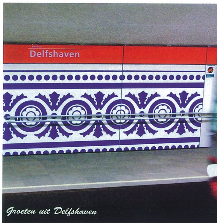
Metrostation Delfshaven, Rotterdam. Titel: Groeten uit Delfshaven.