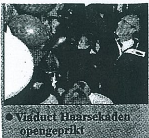
Viaduct Haarsekaden opengeprikt

De tijd van de kille, kuil waar veel verkeer richting Arkel door moest ploeteren, is nu voorbij. „Het is prachtig geworden. En ook veel veiliger met die aparte fietspaden en stoepen.” Een andere voorbijganger ziet de vooruitgang ook zeker. Toch is hij niet helemaal blij met de fietspaden. „De tunnel is prachtig en de paden zijn een enorme verbetering, maar helaas houden de fietspaden op na de tunnel. Dan komen de fietsers toch weer bij het gemotoriseerde verkeer.” De tunnel is volgens hem een goed begin van een betere verkeerssituatie. „Als ze in de toekomst verderop ook fietspaden aanleggen ben ik helemaal blij. Tot nu toe vind ik het heel bijzonder.”