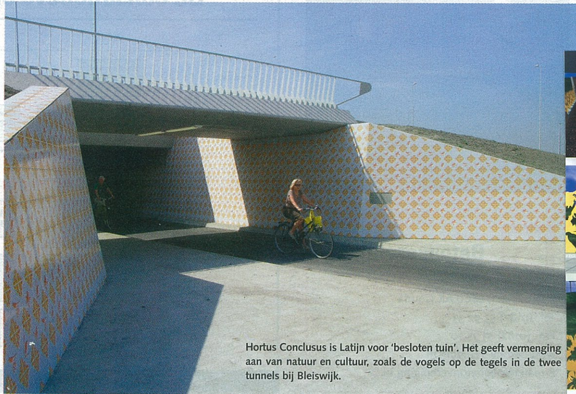
Hortus Conclusus is Latijn voor 'besloten tuin'. Het geeft vermenigvuldiging aan van natuur en cultuur, zoals de vogels op de tegels in de twee tunnels bij Bleiswijk.

Berkman Janssens - kunst in openbare ruimte, heeft het kunstwerk ontwikkeld in opdracht van Prorail en Groenservice Zuid-Holland in samenwerking met Grontmij en Heijmans. De onthulling is 29 juni aanstaande.