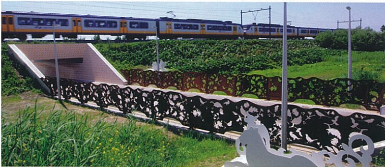
Hortus Conclusus bevindt zich in twee fietstunnels en de openbare ruimte daartussenin.

of juist met contrasten tussen glans en mat. Bijvoorbeeld dat we de decoratie glanzend maken en de rest van de tegel mat. Keramiek heeft voor ons niet zoveel beperkingen. We passen overigens niet uitsluitend keramiek toe; we kijken per project wat het best past. Voor openbare ruimten als tunnels zijn dat altijd tegels. We krijgen weleens aanvragen voor de inrichting van tunnels waarbij men stelt: we hebben niet zoveel geld, maar we willen toch graag een voorstelling. Dan zeggen wij: 'Spaar even door, want schilderwerk is zonde van het geld.' Dat geldt niet voor het plafond, want een mooi wit plafond werkt ruimtevergroterend." Voor elk project bepaalt Berkman en Janssens met welke tegelleverancier ze in