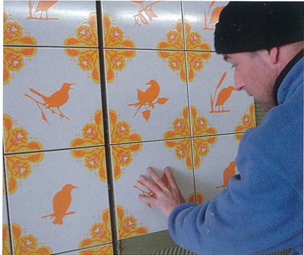
De Hortus Conclusus bevat 1200 vierkante meter tegel met oranjegekleurde motieven van vogelsoorten uit het Rottmerengebied.

Voor wie wil weten hoe Berkman en Janssen precies te werk gaat, is het onlangs verschenen boek 'Hortus Conclusus, de totstandkoming van een kunstwerk' een aanrader. Dit boek, te bestellen via de website van het kunstenaarsduo, geeft een verhelde-